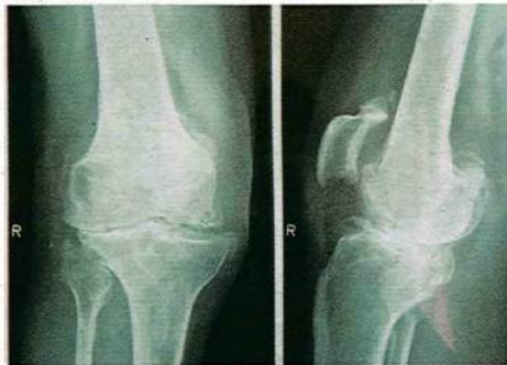
严重的膝盖骨关节炎

也苦不堪言。病人需家人长期照顾，祸累家人。因此，任何老年人，最好能到来做骨质检验，了解骨质指数。发现患上骨质疏松症之后，就应通过药物，加以治疗。如此，就能预防骨质疏松症继续恶化。”身为专科医生，他也为病人护理伤口，包括缝合和洗漆伤口，让伤口更快愈合。