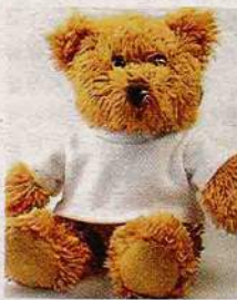
毛茸茸绒毛玩具是尘螨喜欢藏身之处。

在大马，导致鼻炎的元凶祸首是屋里的尘螨 (Dust Mites)、霉菌 (Fungus) 或猫狗的毛和皮屑。一旦吸进鼻腔里，就会患上鼻炎。